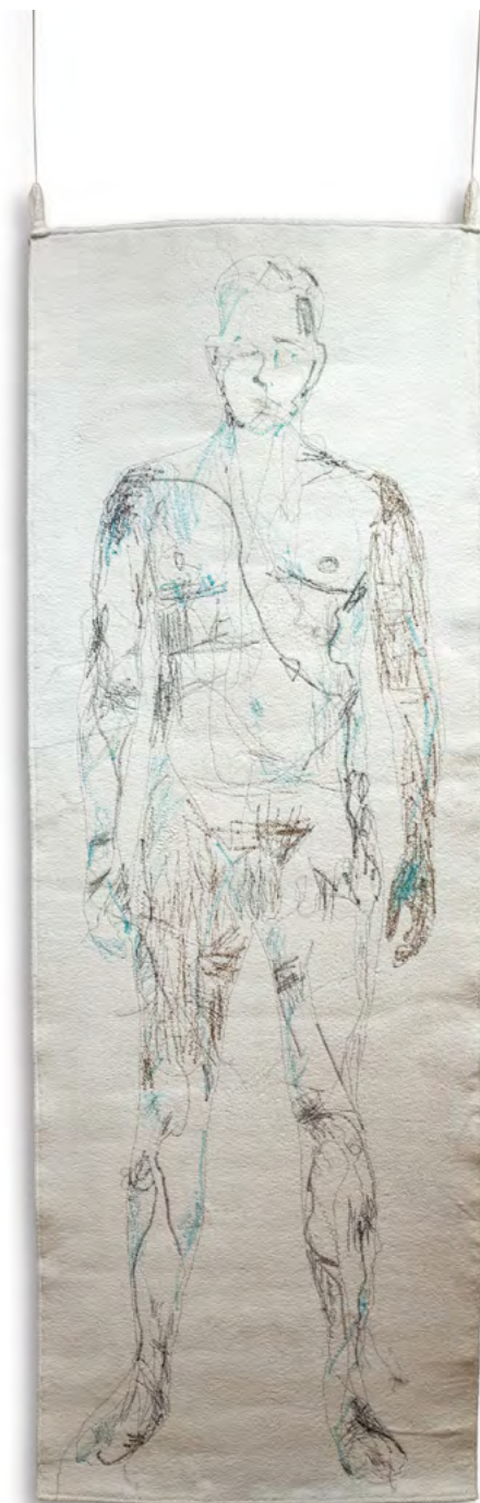
Ciało , 2022 haft na frocie wym.: 198 x 68,5 cm

Od niedawna prowadzi własną markę KARDASJAN. Swój styl określa jako romantic cruising. Jego projekty pojawiają się w teledyskach i sesjach zdjęciowych, między innymi u: Margaret, Natalii Kukulskiej, czy Rosalie.