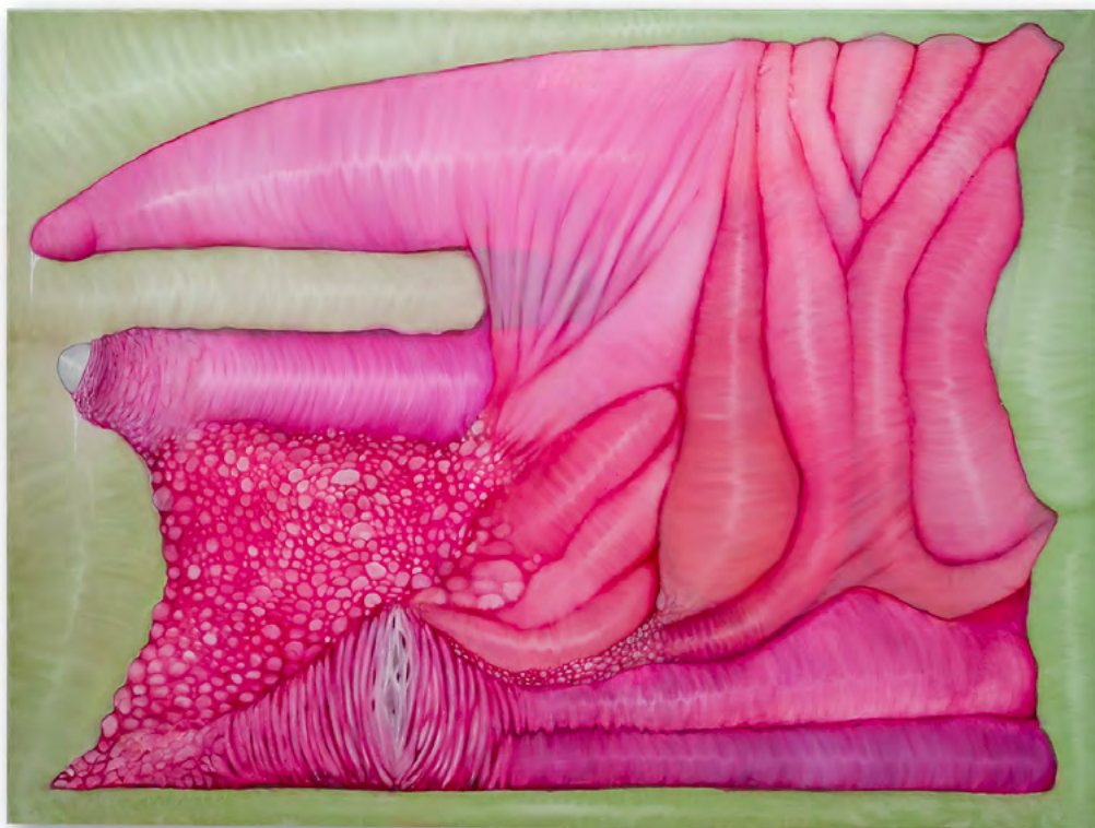
Bez tytułu, 2022 olej na płótnie wym.: 120 x 90 cm

NIEJSZE WYSTAWY: 2013 - „Hochsztaplerzy”, Pracownia Wschodnia, Warszawa (wystawa zbiorowa) 2015 - „Art hole”, Galerii Art Bisto na Stalowej 52, Warszawa (wystawa indywidualna) 2016 - „KREW – WERK”, Fundacja Galerii Foksal, Warszawa (wystawa zbiorowa) 2020- Sklep z mięsem, Pragaleria, Warszawa.