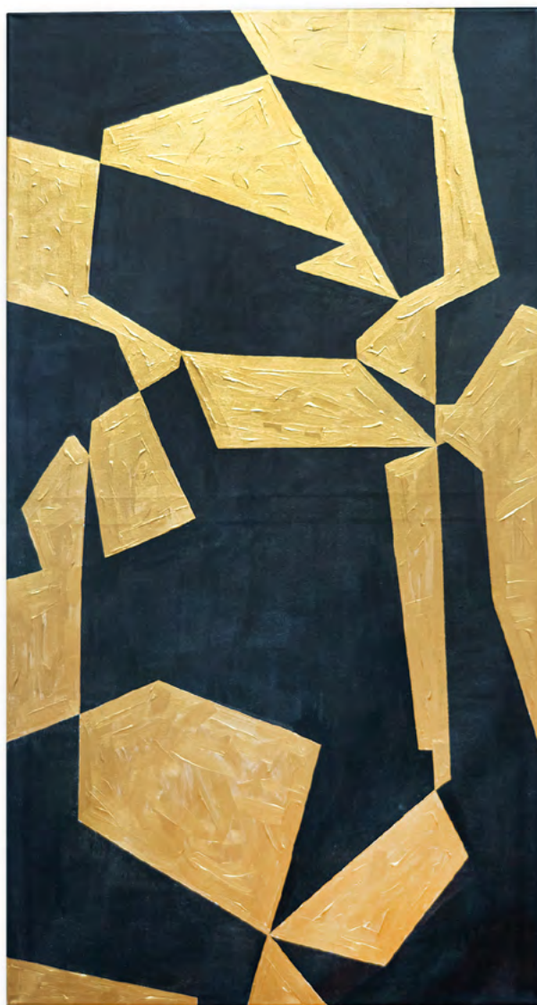
Bez tytułu, 2022 akryl na płótnie wym.: 130 x 80 cm