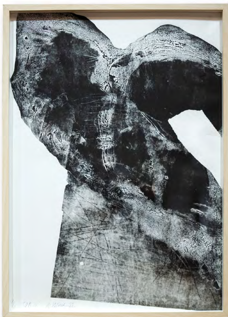
Torso, 2022 grafika warsztatowa wym.: 70 x 50 cm

Jest autorem czterech wystaw indywidualnych oraz uczestnikiem ponad czterdziestu wystaw zbiorowych. Pokazywał swoje prace między innymi w Hiszpanii, Niemczech i w Chinach.