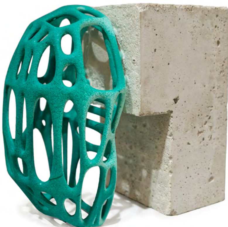
Bez tytułu, 2022 beton i wydruk 3D wym.: 23 x 23 cm

Jego szczere podejście do własnych wartości i estetyki sprawiło, że Zulu zaufały takie firmy jak PUMA, adidas Originals, Reebok, Levi's, Carhartt Work In Progress, Alpha Industries, Eastpak, FILA, OPPO, Coca-Cola, Jameson Irish Whiskey, Jägermeister i wiele innych.