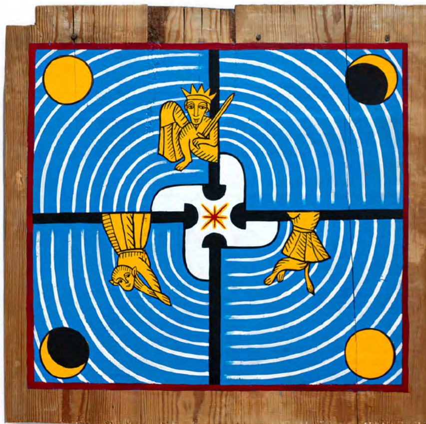
Bez tytułu, 2022 akryl i tusz na desce wym.: 45,5 x 45,5 cm

Specjalizuje się w tatuażu tradycyjnym, ale nie ukrywa, że wiele inspiracji czerpie z nietuzinkowych wzorów z Azji. Podobno już jako dziecko, umiłował sobie wyrazisty kontur i grube, czarne linie. Mimo tego, w swoich pracach lubi i nie boi się bawić intensywnymi kolorami.