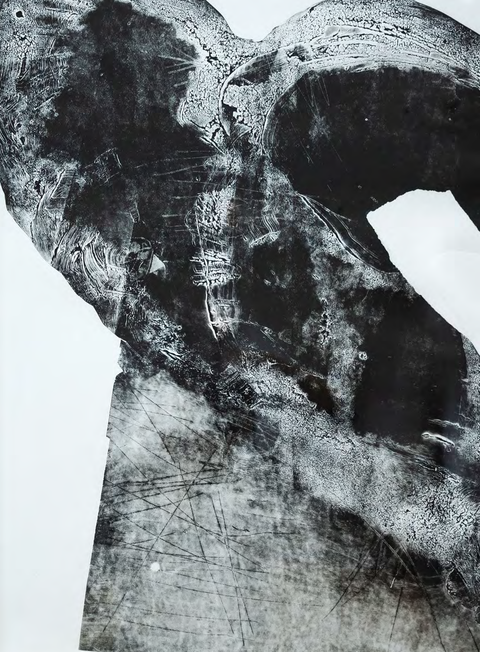
TORSO W. W. Wall 22