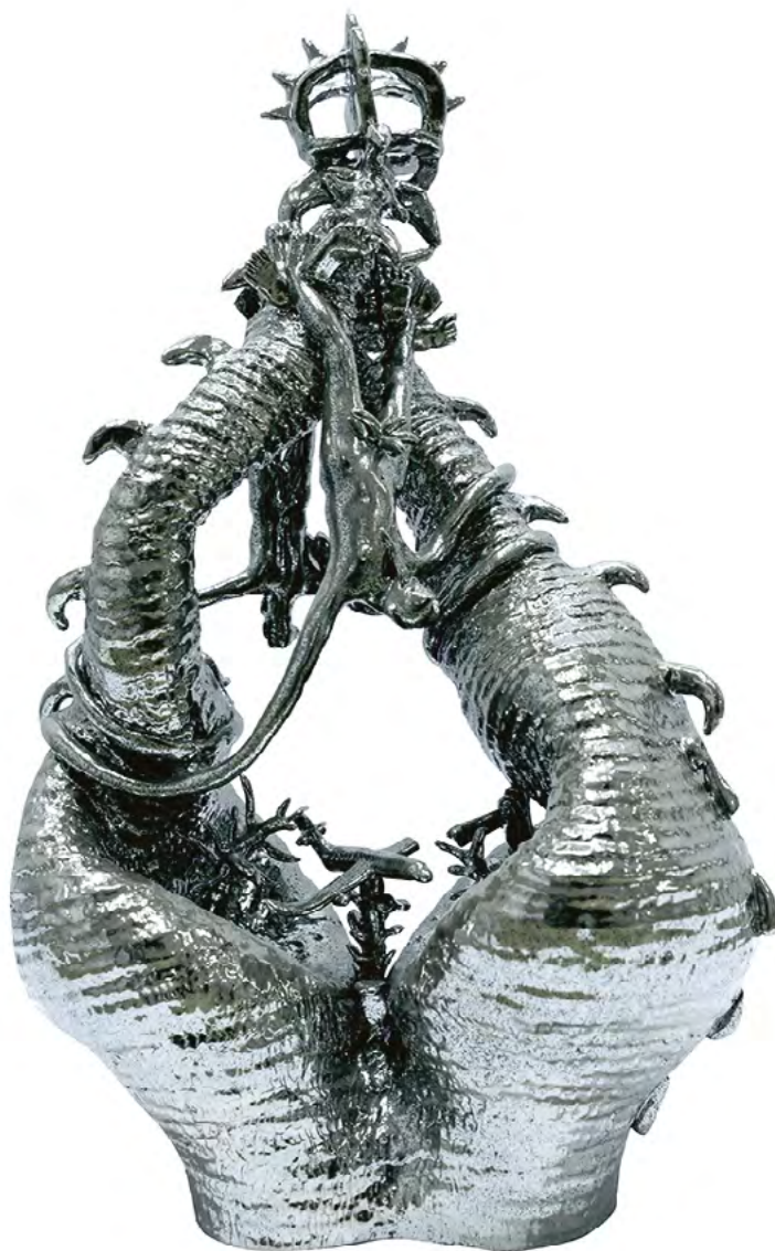
Bez tytułu, 2022 ceramika szklwiona wym.: 61 x 37 cm

W swojej praktyce artystycznej koncentruje się na tym wszystkim co powierzchownie wyparte, niechciane, straszne i zasadniczo ludzkie. Jego twórczość cechuje ogromna różnorodność środków wyrazu, takich jak malarstwo, rzeźba, street art, wideo i ceramika. We wszystkich tych obszarach praktyk artystycznych charakteryzuje go osobliwe podejście do własnych doświadczeń, przenoszenie historii w wymiar uniwersalnych opowieści, a także świadome operowanie skalą miniatur.