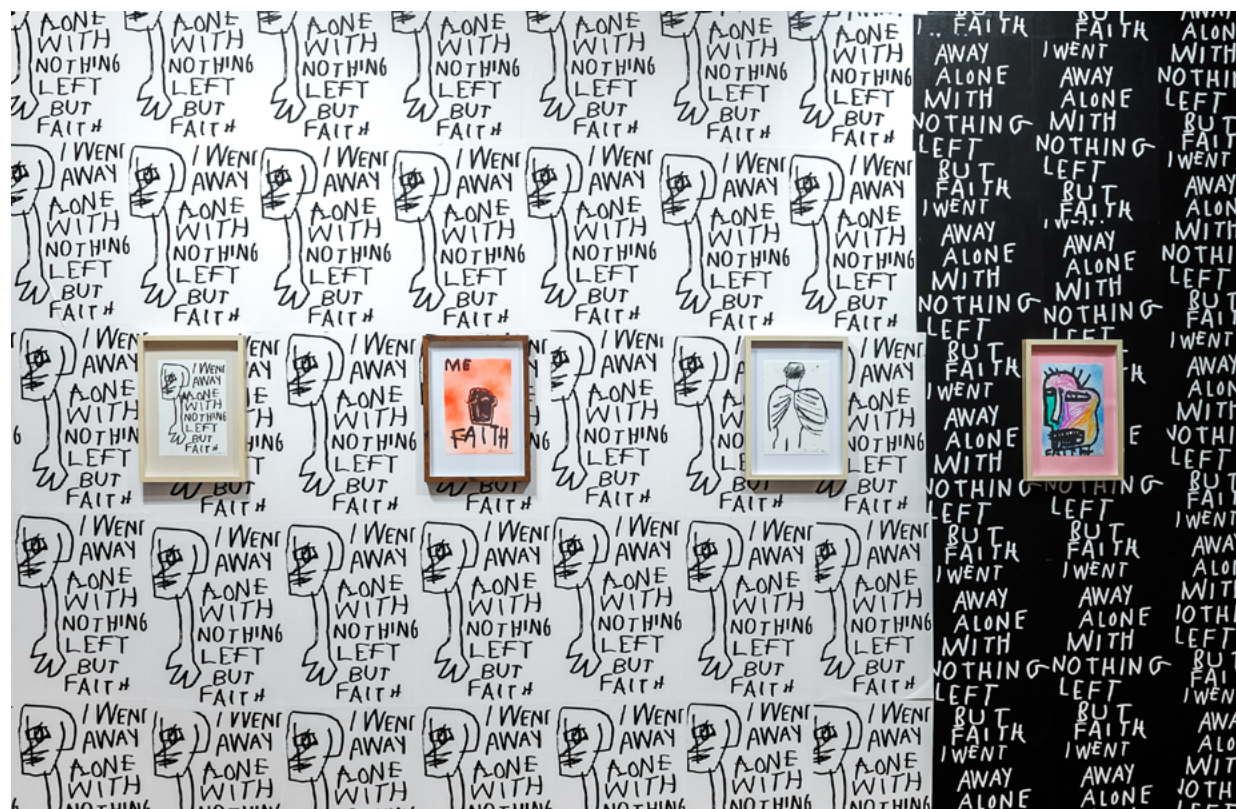
I went away alone with nothing left but faith, 2022

Artysta ma na swoim koncie kilkanaście wystaw indywidualnych i zbiorowych, między innymi w Polsce i zagranicą: Muzeum Designu w Barcelonie, Nerima Art Museum w Tokio, czy Hamburger Bahnhof - Museum für Gegenwart w Berlinie.