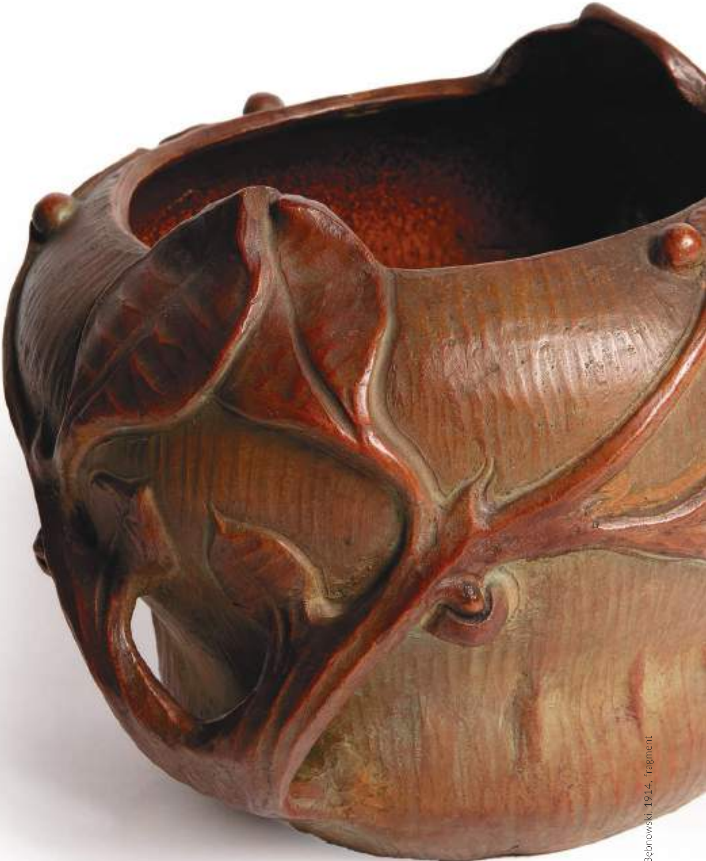
Wacław Bebnowski, 1914, fragment